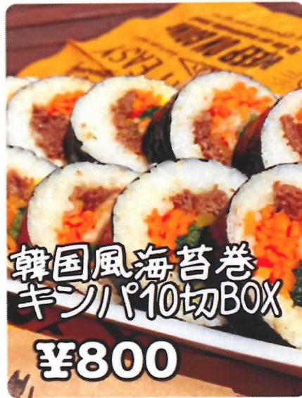
韓国風海苔巻 キンパ10切BOX ¥800