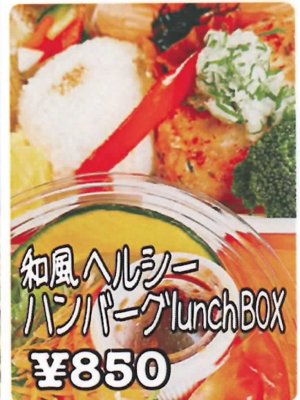
和風ヘルシー ハンバーグlunchBOX ¥850